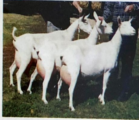
ماعز السانين في أوروبا