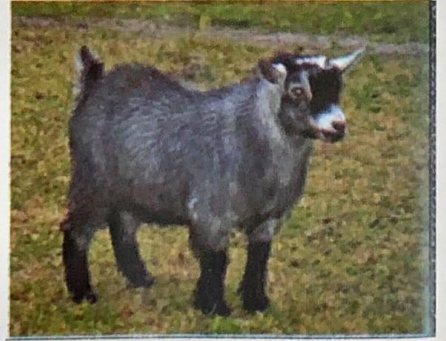
شكل ( 1- 30 ) ماعز البيجمي القزم