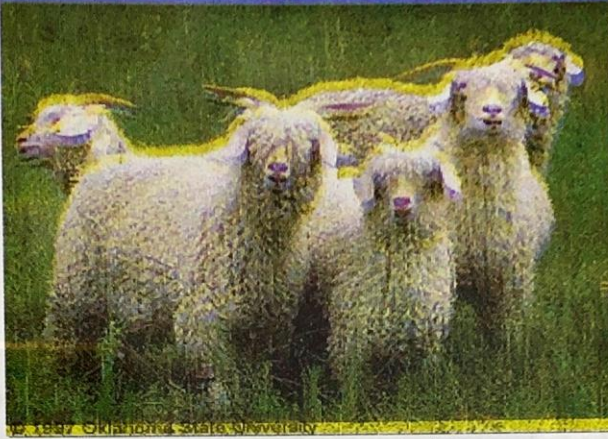
شكل ( 1-31 ) ماعز الانكورا

يربى هذا النوع من الماعز في مدينة أنقرة في تركيا ، له القدرة على العيش في ظروف بيئية متباينة ، كلا الجنسين ذو قرون منحنية الى الخلف وأنف مستقيم وأذان متدلّية وله لحية ، يبلغ وزن الذكر البالغ حوالي 50-60 كغم والانثى البالغة حوالي 30-50 كغم ، يغطي جسمه شعر ابيض حريري طويل متموج لماع وتصل طول الخصلة حوالي 18 -25 سم ووزن الجزة حوالي 3-5 كغم ، وتتم عملية الجز مرتين في السنة يستعمل الشعر في صناعة الملابس الشتوية الفاخرة .