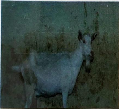
ماعز السانين في العراق

الموطن الأصلي هو سويسرا ومنها أنتشرت الى مختلف بلدان العالم . يكون لون الشعر أبيضاً أو كريمياً أو أشقراً مع وجود بقع داكنة اللون على المخطم والجفون والأذن والضرع ، عديم القرون في كلا الجنسين ، ذات أذان منتصبه متجهة للأمام وقد تكون لها لحية ، لها صفات حيوان الحليب ، فالضرع جيد التكوين حجمه كبير نسبياً وقد يصل وزن الذكر البالغ حوالي 75 - 100 كغم والإنثى البالغة حوالي 50-70 كغم . طول موسم الحليب يتراوح بين 8-10 أشهر وبمعدل إنتاج موسمي للحليب هو 800 كغم بنسبة دهن حوالي 3.5% .