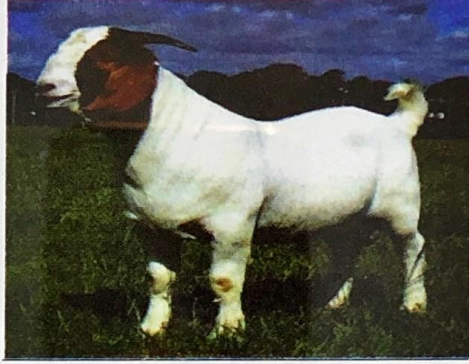
شكل ( 1- 29 ) ماعز البوير

موطنه الأصلي جنوب أفريقيا ومنه أنتشر الى عدة أماكن من العالم تمتاز بمقاومتها العالية للأمراض والتأقلم على الظروف البيئية القاسية . يغطي الجسم شعر قصير أبيض مع وجود بقع حمراء في الرقبة والرأس . تمتاز أيضاً بسرعة النمو وكبر الجسم وسرعة البلوغ الجنسي وارتفاع نسبة الخصوبة . يبلغ وزن الذكر البالغ حوالي 90 كغم ، أما الأنثى فحوالي 60 كغم ، تبلغ نسبة التصافي فيها حوالي 40-52% .