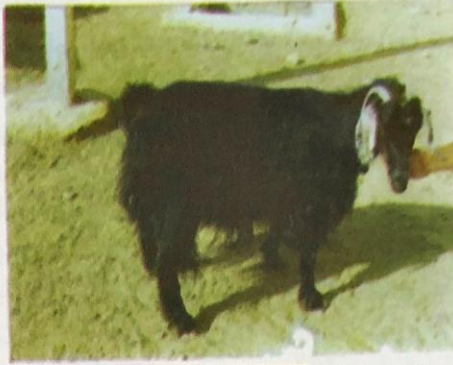
شكل ( 1- 33 ) الماعز الجبلي الأسود

1. الماعز الجبلي الأسود : يوجد في المناطق الشمالية الجبلية من العراق وهو صغير الحجم أسود اللون في كلا الجنسين ذات قرون . الغرض من تربيته هو لإنتاج اللحم والحليب والشعر .