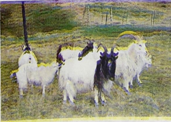
شكل ( 1-32 ) ماعز الكشمير

موطنه الأصلي مرتفعات الهماليا في الصين ، وهو متأقلم للعيش في المناطق الجافة ، لون الشعر ابيض ، ذو قرون طويلة ، يجز مرة واحدة في السنة ، يربى لإنتاج اللحم والجلد والشعر الذي يستعمل في صناعة الملابس الشتوية الفاخرة .